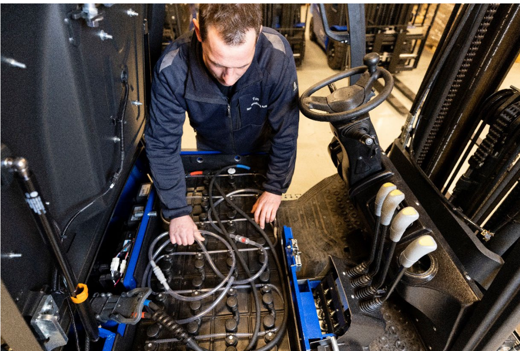
Billede 3: Hos NH Handling har man etableret et serviceteam, så man nu også kan tilbyde service på alle maskiner samt alle gængse mærker inden for internt transportmateriel, fx de lovpligtige serviceeftersyn.